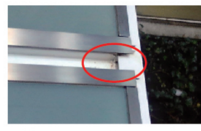
排水口下にプレート1枚分の厚さの段差を発見。