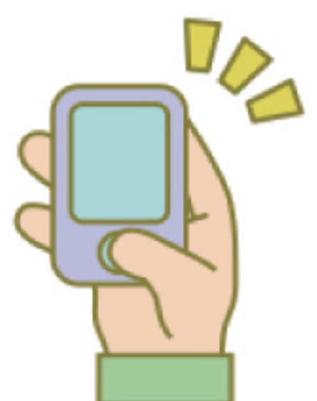
端末はボタンを押すだけ！