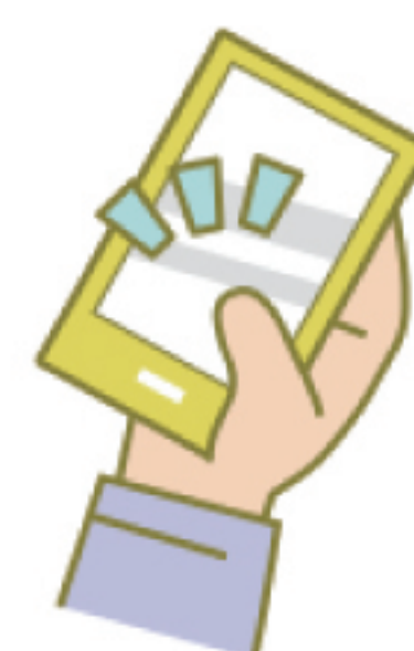
スマホもアプリのボタンを押すだけ！

「出勤したらボタンを押す」「退勤のときボタンを押す」基本操作はこれだけです。心配は要りません、大丈夫です！